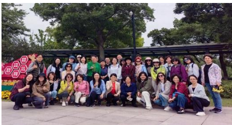
外国语学院分工会供稿

外国语学院通过此次春游活动，展现了教师团队的团结与活力，同时也为各位教职员工提供了一个放松身心、增进交流的机会。学院表示，将继续举办类似的活动，以促进教师团队的建设和发展。